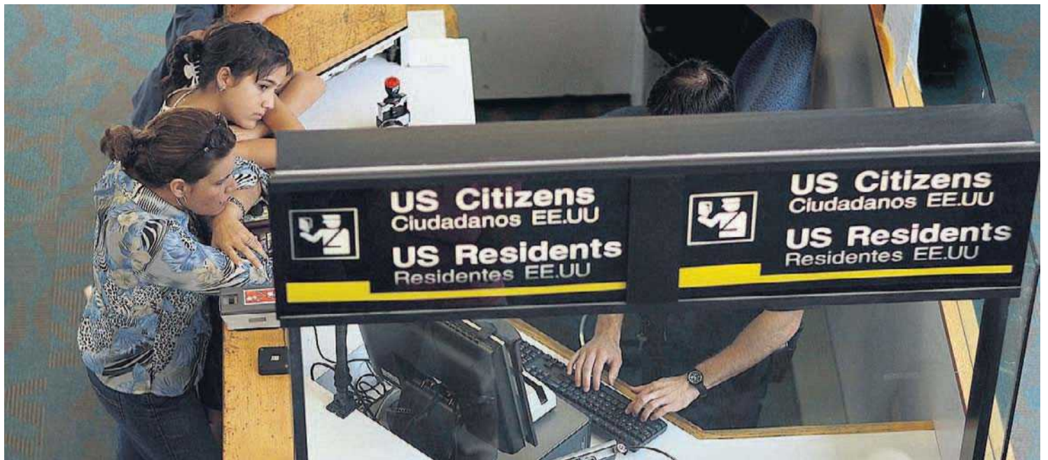
HÅRD KOLL. USA:s skärpta kontroll av besökare till landet har skapat politisk irritation i Bryssel – och besvär för många affärsresenärer.

131 utländska soldater har dödats i Afghanistan hittills i år, rapporterar norska tidningen Aftenposten. (DI)